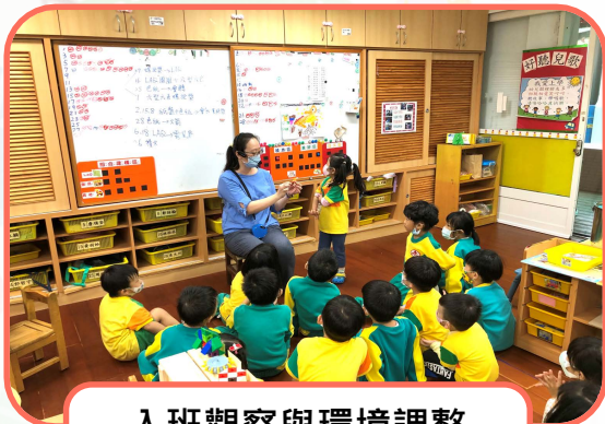
入班觀察與環境調整