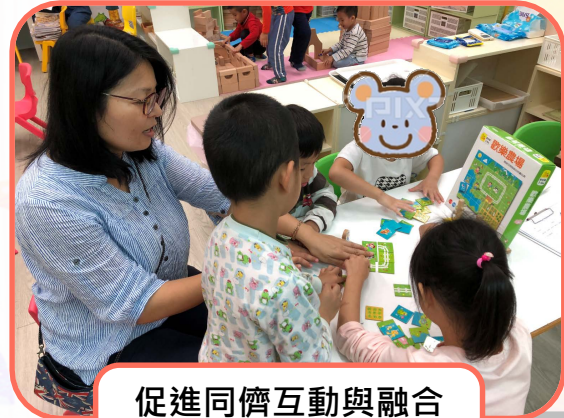
促進同儕互動與融合