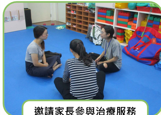
邀請家長參與治療服務