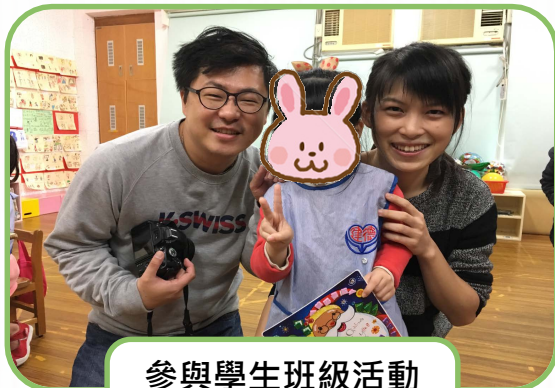
參與學生班級活動