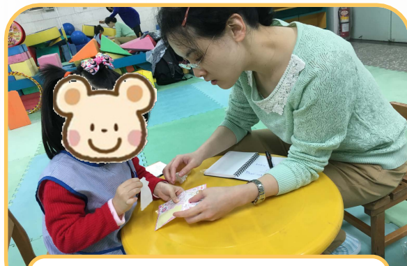
提供個案能力評估與教學建議